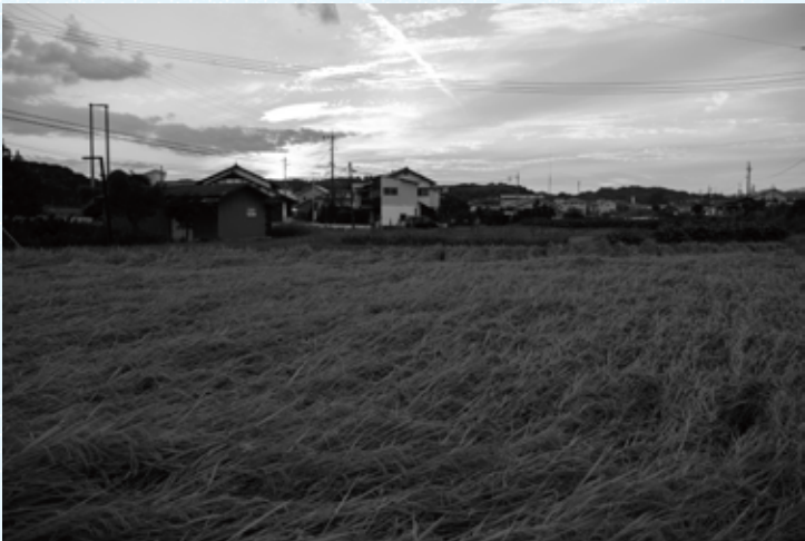
「DRIFTING CLOUDS」2023 | サイズ可変 | アーカイバルピグメントプリント 表面下 | 小林正秀「DRIFTING CLOUDS」

中桐 聡美 1995 岡山県倉敷市児島出身 2018 金沢美術工芸大学美術工芸学部油画専攻卒業 2020 京都市立芸術大学大学院美術研究科絵画専攻版画修了 2024 京都市立芸術大学大学院美術研究科博士(後期)課程在籍中 2024 岡山県新進美術家育成「I氏賞」奨励賞